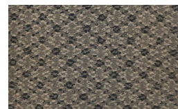
554 - Black Diamond