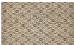
550 - Ambar