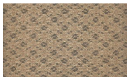
551 - Golden