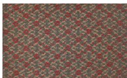
552 - Presidential